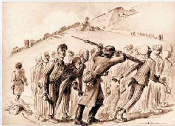
'Scène de vie du camp' Dessin de Henri Gayot Collections du Centre européen du résistant déporté - STRUTHOF Droits réservés