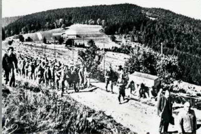
photo : Déportés du KL-Natzweiler Centre européen du résistant déporté - STRUTHOF

Pour certains détenus, le calvaire se prolonge par d'interminables marches de la mort. Les autres camps annexes de la nébuleuse Natzweiler sont libérés à partir du début de l'année 1945. ■