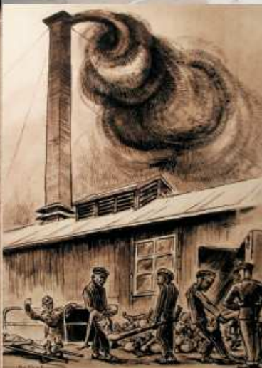
'Four crématoire' Dessin de Henri Gayot, Collections du Centre européen du résistant déporté - STRUTHOF Droits réservés

En mars 1942, sept baraques, sur les dix-sept que comptera la première enceinte du camp, sont achevées, et le Kommando de travail de la carrière est constitué : 200 à 300 déportés, avec 160 civils, ouvriers et employés.