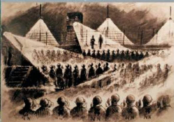
'Rassemblement' - Dessin de Henri Gayot