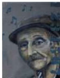
Raymond Gurême tsigane