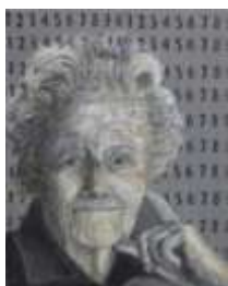
Germaine Tillion résistante