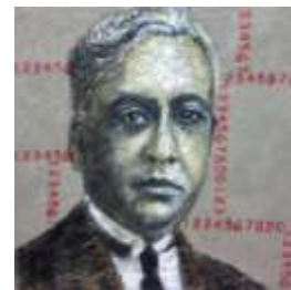
Consul du Portugal Aristides de Sousa Mendes nommé Juste