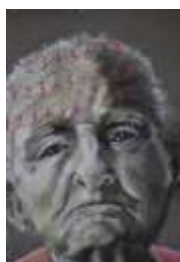
Rudolph Brazda homosexuel