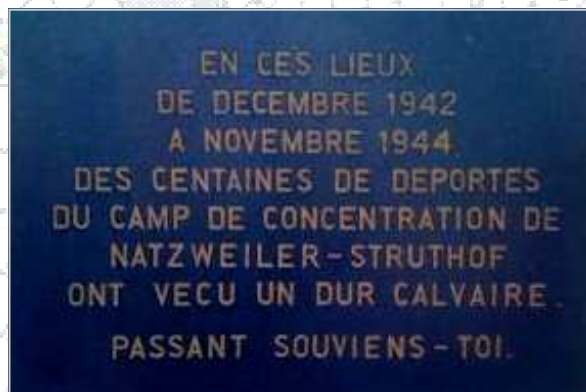
Plaque commémorative apposée sur les murs de l'actuel club équestre de la ville, situé Parc de Hell

En novembre 1944, face à l'avancée des Alliés en Alsace, les derniers déportés encore à la disposition de l'école des transmissions quittent Obernai pour Heidenheim.