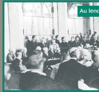
Au lendemain de la Grande Guerre « la paix ratée »

La Première Guerre mondiale laisse la France, comme presque toute l'Europe, mutilée et exsangue. Le bilan est effroyable, la reconstruction s'annonce longue et terriblement coûteuse tandis que les survivants entretiennent l'espoir d'avoir mené la dernière guerre, « la der des ders ». Pourtant, les frustrations, les crispations et les désillusions provoquées par cette guerre (qui ne vont pas être, loin de là, réglées par les traités) et accentuées par la crise économique, vont conduire à la montée des totalitarismes et à l'échec final du système de sécurité collective mis en place par la Société des Nations (S.D.N.). La Seconde Guerre mondiale est l'héritière logique de la « der des ders ».