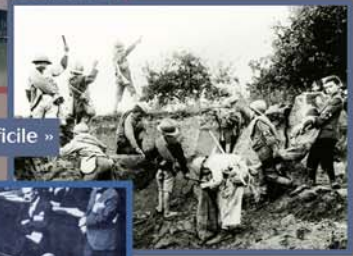
Une société traumatisée, « une évolution difficile »