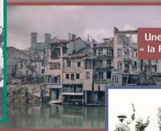
Une reconstruction difficile, « la France panse ses plaies »