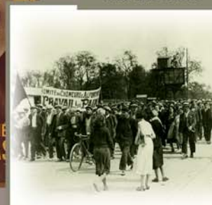
La marche à la guerre, « mourir pour Dantzig »