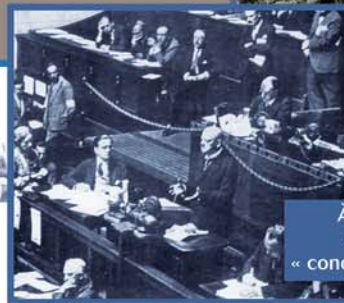
À la recherche de la sécurité collective, « conciliation, arbitrage, paix »