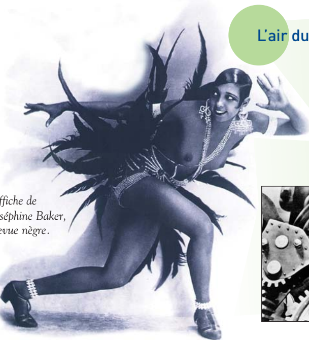
■ Affiche de Joséphine Baker, Revue nègre.