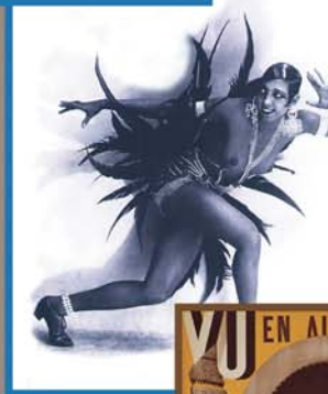
L'air du temps, « la vie quand même »