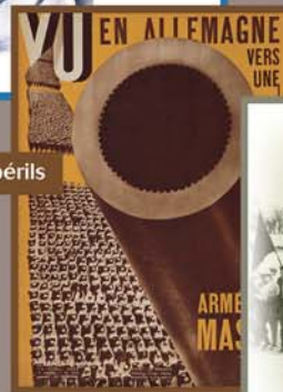
La montée des périls