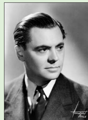
■ Jean Moulin.

En juin 1943, les Allemands savent qu'ils détiennent Max, mais ils ne l'identifient pas. Les prisonniers sont acheminés tous les jours au siège de la Gestapo où ils sont interrogés sous les pires tortures infligées par Klaus Barbie. Jean Moulin sait tout, mais ne dévoile ni les structures ni l'organisation du C.N.R. Mais Klaus Barbie parvient à identifier Max. A la fin du mois, il est acheminé à Neuilly-sur-Seine dans une villa réservée aux prisonniers importants. Lors de son transfert en Allemagne, Jean Moulin succombe, officiellement, le 8 juillet 1943 à Metz, des suites des mauvais traitements reçus. Les autorités allemandes ordonnent aussitôt son incinération au cimetière du Père Lachaise à Paris.