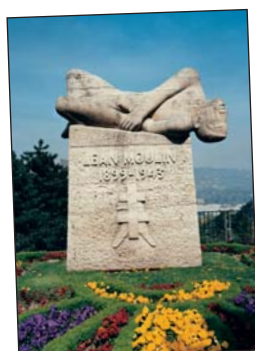
■ Monument de Caluire

■ À l'occasion du vingtième anniversaire de la Libération, le général de Gaulle décide de transférer l'urne contenant les cendres de Jean Moulin au Panthéon. La cérémonie a lieu le 19 décembre 1964. André Malraux, ministre de la Culture, lui rend hommage dans un discours resté célèbre. Ci-dessus, le Président de la République, Charles de Gaulle et Georges Pompidou, Premier ministre, lors de la cérémonie de transfert.