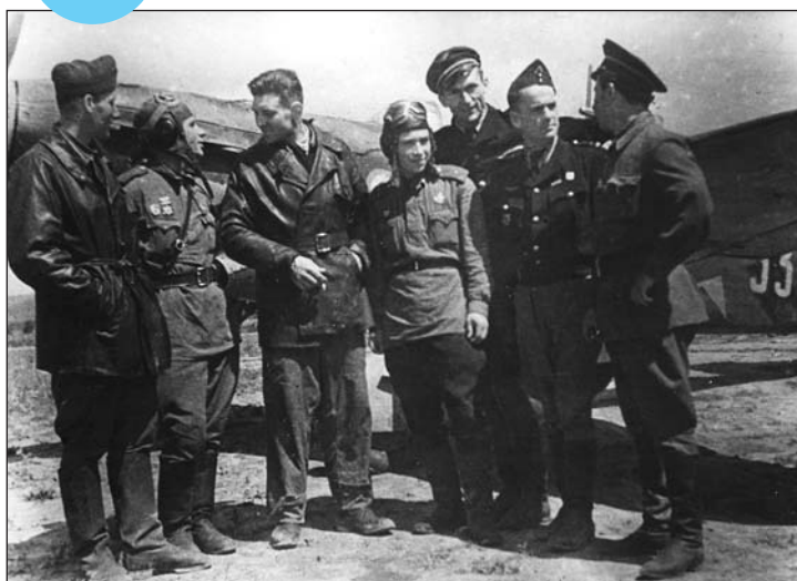
■ Pilotes du « Normandie » et pilotes soviétiques à l'été 1943.

Le 9 mai 1945, jour de la célébration de l'armistice en URSS, « Normandie-Niemen » est de tous les groupes de chasse français celui qui totalise le plus de victoires (273).