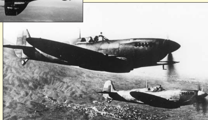
■ Vol en formation de Spitfire de la R.A.F.