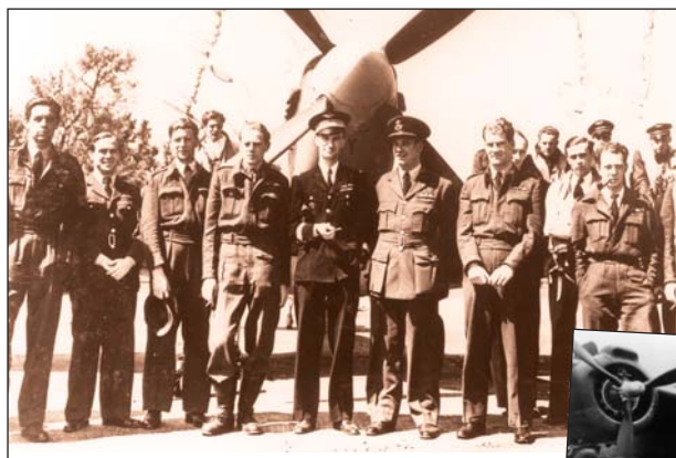
■ Le commandant René Mouchotte entouré de son groupe.