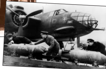
■ Chargement de bombes sur un Boston du groupe de bombardement « Lorraine ».

Les quelques milliers de soldats de l'armée de l'air, qui continuent le combat forment dès juillet 1940 les Forces Aériennes Françaises Libres. Ils servent aux côtés des Alliés dans plusieurs unités de chasse, de reconnaissance ou de bombardement, en Angleterre ou en Afrique et plus tard en Union Soviétique.