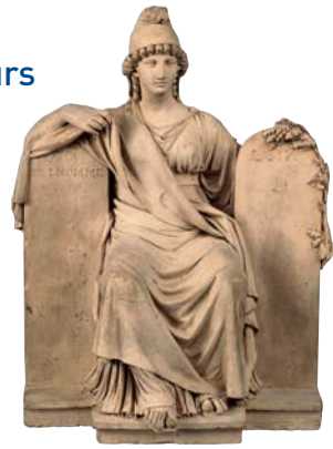
■ La République s'appuyant sur la déclaration des droits de l'homme et sur les lois.

Aux origines de notre État de droit, la Déclaration des droits de l'homme et du citoyen est proclamée le 26 août 1789. Elle apparaît avant même la République et pose un certain nombre de principes philosophiques qui mettent l'homme au cœur de ses préoccupations. Parmi ceux-ci, on peut retenir l'égalité, la liberté, la propriété, la sûreté et la résistance à l'oppression. Ces principes fondamentaux ont une vocation universelle et se retrouvent dans l'élaboration de constitutions de nombreuses démocraties.