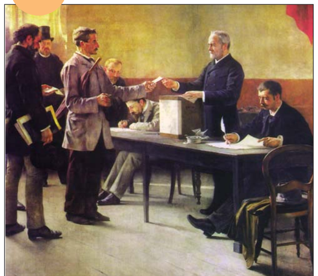
■ Un bureau de vote lors des débuts de la III ème République, vers 1880.