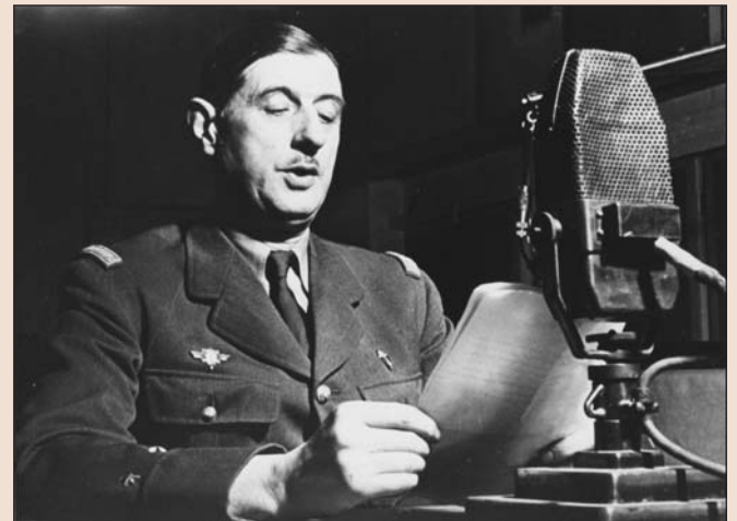
■ L'appel du général de Gaulle, le 18 juin 1940, reprenant le flambeau de la III ème République chancelante, au lendemain de la demande d'armistice par le maréchal Pétain, exhorte à poursuivre le combat.