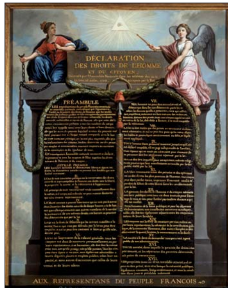
■ La Déclaration des droits de l'homme et du citoyen de 1789.