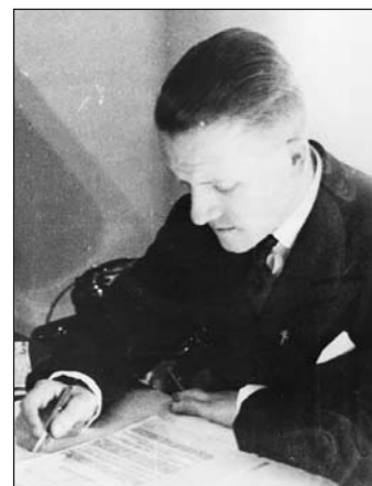
■ Henri Frenay