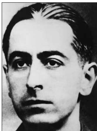
■ Pierre Brossolette

Des initiatives individuelles dispersées sont à l'origine de la Résistance. Beaucoup se retrouvent déjà autour d'une seule obsession : faire quelque chose contre l'occupant et l'ordre nazi.