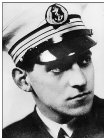
■ Honoré d'Estienne d'Orves